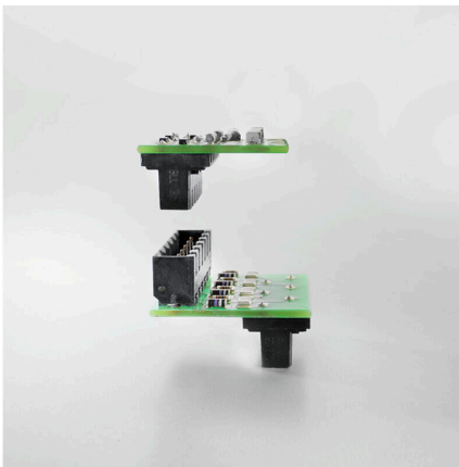
Connection made easySafe board-to-board connection