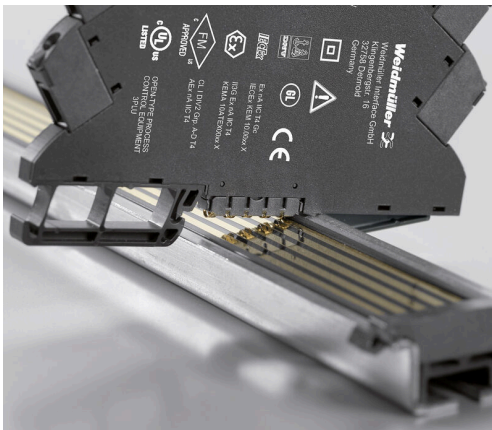
Opzione di alimentazione elettrica aggiuntiva tramite bus