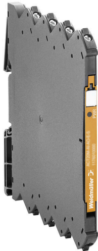
Illustrazione del prodotto, Simile alla figura

Il trasduttore di misura della frequenza universale configurabile via software isola e converte i segnali di ingresso (frequenza, Namur, NPN, PNP, tacho, TTL e SO) in un segnale di uscita analogico attivo standard. L'alimentazione elettrica è isolata galvanicamente da ingresso e uscita (isolamento a 3 vie) e avviene mediante un cablaggio diretto. Il modello ACT20M-FRQ-AO-S può essere alimentato mediante il bus su guida DIN di Weidmüller