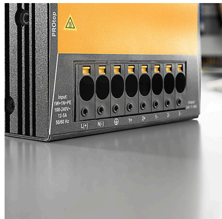
Power up to UL 600 V offset solder pins