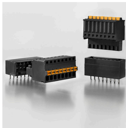
Flexible application Outlet direction: 90° and 180°