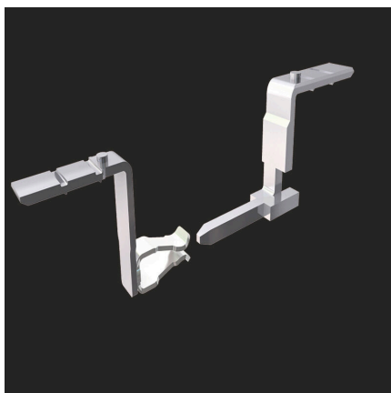
Uncompromising functionality High vibration resistance