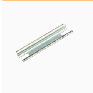
Serie K Klippon®, Accessori