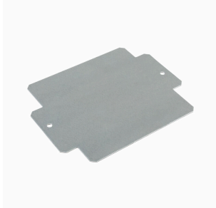
Serie K Klippon®, Accessori