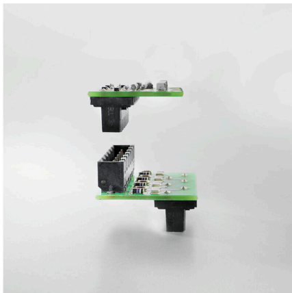
Connection made easySafe board-to-board connection