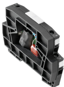
Come da figura