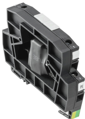
Come da figura