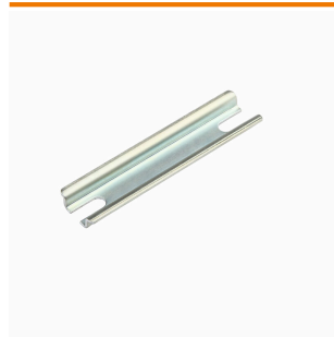
Serie K Klippon®, Accessori