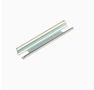
Serie K Klippon®, Accessori