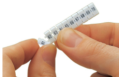
Separazione di una singola etichetta dalla striscia di marcatura WMB: per i morsetti più larghi.