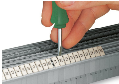
Innesto di una striscia di marcatura WMB nella sede per marcatura.