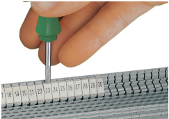
Innesto di una striscia di marcatura WMB nella sede per marcatura del supporto per targhetta doppio.