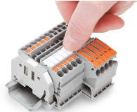
Innesto di una striscia di marcatura WMB nella sede per marcatura.