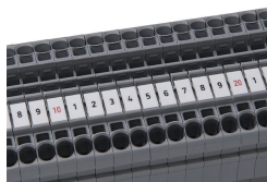
Marcatura a "decadi" WMB