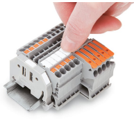
Innesto di una striscia di marcatura nella sede per marcatura.