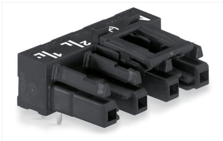
Colore: ■ nero