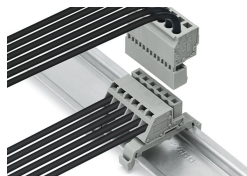
Connettore femmina angolato con adattatore per guida DIN 35 (209-120)