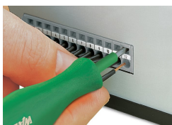
Morsettiere passanti per circuiti stampati - terminazione frontale dei conduttori