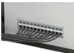
Le morsettiere passanti per circuiti stampati sono utilizzabili come passanti sul pannello frontale per la terminazione di conduttori esterni.