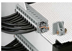
Con flange per il montaggio sul circuito stampato o sul pannello frontale, sia a filo che sporgente rispetto all'alloggiamento