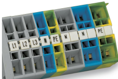
Marcatura con sistema di marcatura rapida Mini-WSB Quick.