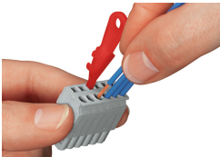
Connessione del conduttore in parallelo all'azionamento CAGE CLAMP®