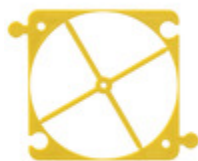
V71571 - Accessorio multifunzione 2M p/leggere