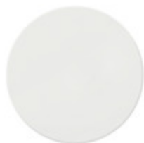
V71632 - Coperchio filo muro 2M