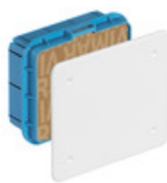
V70002 - Scatola derivazione incasso 116x92x50mm