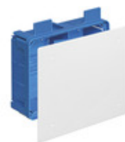
V72006 - Scatola deriv. p/leggere 205x164x73,5mm