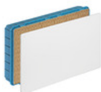
V70011 - Scatola derivazione incasso 515x292x80mm