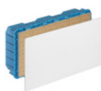
V70211 - Scatola derivazione incasso 515x248x120