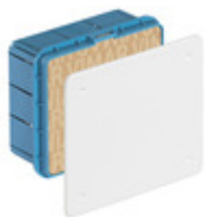
V70005 - Scatola derivazione incasso 154x128x70mm