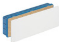
V70009 - Scatola derivazione incasso 479x154x70mm