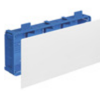
V72008 - Scatola deriv. p/leggere 402x164x73,5mm