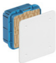
V70001 - Scatola derivazione incasso 92x92x50mm