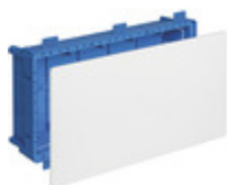
V72211 - Scatola deriv. p/leggere 533x263x120mm