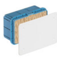
V70004 - Scatola derivazione incasso 154x92x70mm