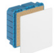
V70207 - Scatola derivazione incasso 248x248x120