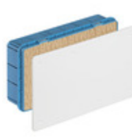
V70007 - Scatola derivazione incasso 287x154x70mm