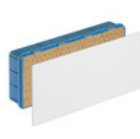
V70008 - Scatola derivazione incasso 391x154x70mm