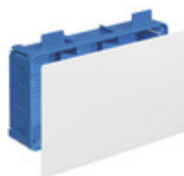
V72007 - Scatola deriv. p/leggere 298x164x73,5mm