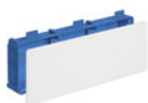
V72009 - Scatola deriv. p/leggere 490x164x73,5mm