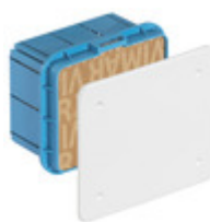
V70003 - Scatola derivazione incasso 116x92x70mm