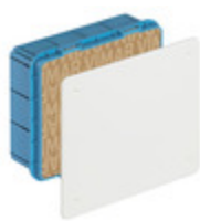
V70006 - Scatola derivazione incasso 195x154x70mm