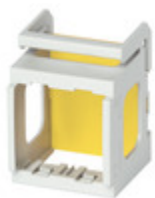
V51922 - Supporto 2M Eikon/Arké/Plana guida DIN