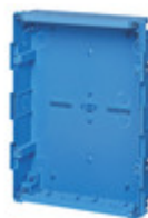
V53724 - Scatola inc. centr. 24Mp/leggere azzurro