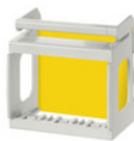
V51923 - Supporto 3M Eikon/Arké/Plana guida DIN