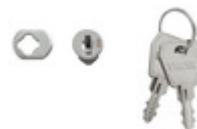
V53597 - Serratura chiave per centralino estetico