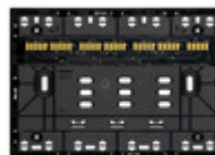
32603.G - Supporto XT 3M nero