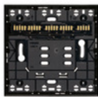
32602.G - Supporto XT 2M nero