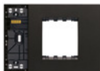
32613.G - Supporto XT 3M misto con placca nero