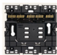
32602.B - Supporto XT 2M bianco