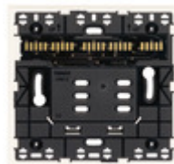
32602.B - Supporto XT 2M bianco