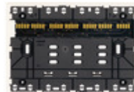
32603.B - Supporto XT 3M bianco