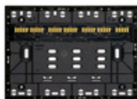
32603.G - Supporto XT 3M nero