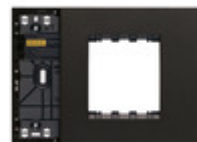
32613.G - Supporto XT 3M misto con placca nero