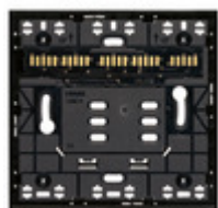
32602.G - Supporto XT 2M nero