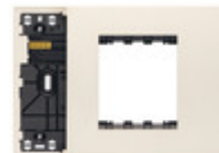
32613.C - Supporto XT 3M misto con placca canapa