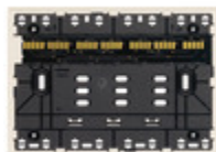
32603.C - Supporto XT 3M canapa