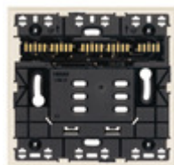
32602.C - Supporto XT 2M canapa