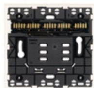
32602.B - Supporto XT 2M bianco