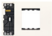
32613.B - Supporto XT 3M misto con placca bianco