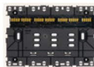
32603.B - Supporto XT 3M bianco