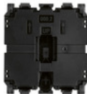
30004.2 - Meccanismo deviatore 1P 10AX 2M