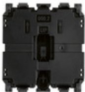
30000.2 - Meccanismo interruttore 1P 10AX 2M