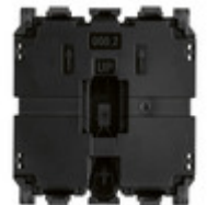
30012.2 - Meccanismo invertitore 1P 10AX 2M