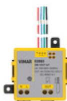
03983 - Modulo 3IN 1OUT connesso IoT