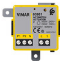
03981 - Modulo relè connesso IoT