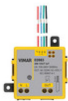
03983 - Modulo 3IN 1OUT connesso IoT