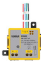
03983 - Modulo 3IN 1OUT connesso IoT