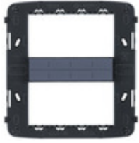
21618 - Supporto 8M con viti