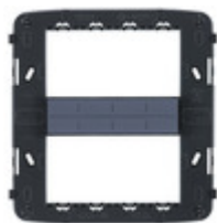
21618 - Supporto 8M con viti