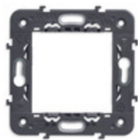
21603 - Supporto 2M senza viti int71