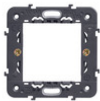
21602 - Supporto 2M con griffe int71