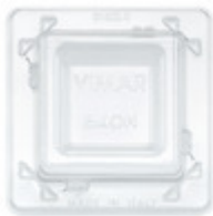
21602.C - Protezione supporto 2M Eikon