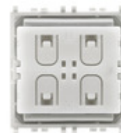
03905 - Comando ZigBee Green Power