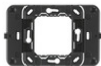
20507 - Supporto radio placca 2M o 2MC grigio