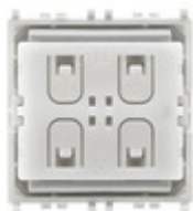
03906 - Comando radio Zigbee Friends of Hue