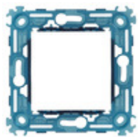
19603 - Supporto 2M senza viti int71