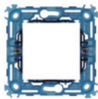
19602 - Supporto 2M + griffe int71