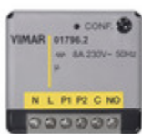
01796.2 - Attuatore EnOcean multifunzione 1 relè