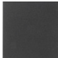
19506.2 - Tasto 2M comando radiofrequenza grigio