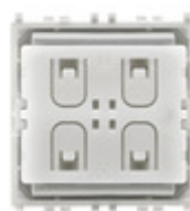
03906 - Comando radio Zigbee Friends of Hue