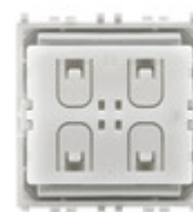
03925 - Comando radio Bluetooth Low Energy