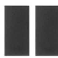
19506 - Tasto 1M com. radiofrequenza grigio 2pz