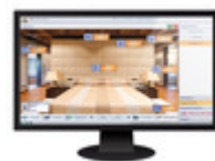
OK01590.1 - Kit Well-Contact Suite Basic PC Client