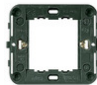
17082 - Supporto 2M ridotti +griffe