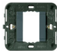
17080 - Supporto liscio 1M +griffe grigio