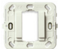
17086.B - Supporto liscio 1M s/viti d60/56x56mm b