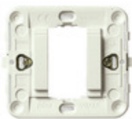
17080.B - Supporto liscio 1M +griffe bianco