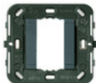
17086 - Supporto liscio 1M s/viti d60/56x56mm g