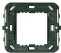
17087 - Supporto 2M ridotti s/viti d60/56x56mm