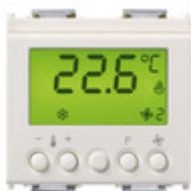
16915.B - Termostato KNX bianco