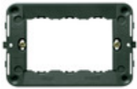
16713 - Supporto 3M +viti