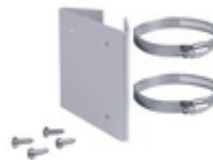
14969 - Staffa fissaggio palo contenitore 14962