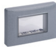
14943.14 - Calotta IP55 3M +viti grigio granito