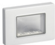
14943 - Calotta IP55 3M +viti grigio RAL 7035