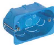
V71703 - Scatola inc. 3M p/leggere azzurro