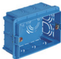
V71303 - Scatola incasso rettang. 3M azzurro