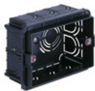
V71303.AU - Scatola incasso rettang. autoest. 3M nero