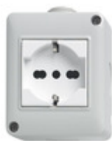
14802.U - Plana- Contenitore IP40 2M+presa univers