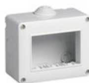
14803 - Contenitore IP40 3M