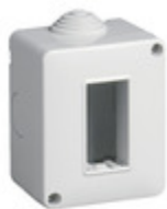
14801 - Contenitore IP40 1M