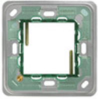
14607 - Supporto 2M BS