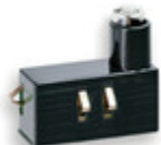
00931 - Unità precablata LED 110-250V 0,5W ambra