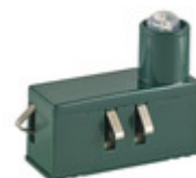
00932 - Unità prec.LED110-250V 0,5W diurna verde