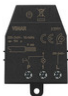
03991 - Modulo relé ad impulsi Quid 10A